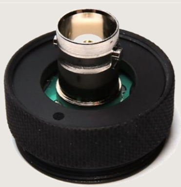
نمای پشت حسگر

4 در صورت اشباع شدن حسگر، شکل خروجی اسیلوسکوپ مشابه پالس مربعی خواهد بود. با استفاده از تضعیف کننده‌های نوری یا تابش غیر مستقیم پرتو به حسگر، می‌توان از این پدیده جلوگیری کرد.