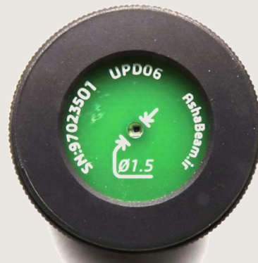
نمای روبروی حسگر